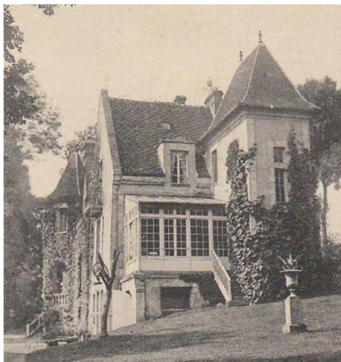
Propriété de « Brise-Bèche »