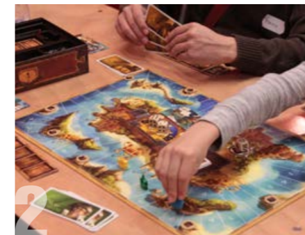
FESTIVAL DES JEUX DE SOCIÉTÉ Samedi 26 et dimanche 27 octobre