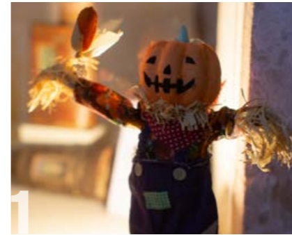
SOUP'Ô CONTES D'HALLOWEEN Vendredi 25 octobre