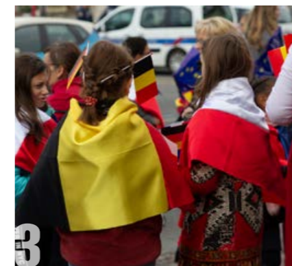
JOURNÉE EUROPÉENNE DU JUMELAGE Samedi 2 novembre