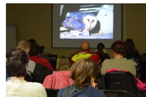
NUIT DE LA CHOUETTE Vendredi 28 février