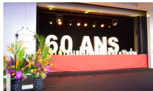
PRIX NATIONAL DE L'ARBRE Mercredi 5 février