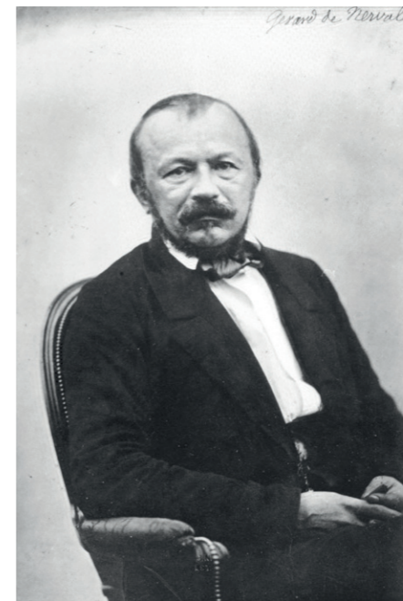
Portrait de Gérard Labrunie, dit Gérard de Nerval, photographie par Félix Nadar (1820-1910).

Malgré tout, Nerval conserva de nombreux et agréables souvenirs du Valois. Il y fut élevé et y revint souvent pour s'inspirer. Publiée en 1853 dans la Revue des deux Mondes , la nouvelle poétique Sylvie en est une parfaite illustration. Histoire fictive d'une idylle champêtre, l'œuvre évoque l'amour de jeunesse du narrateur pour une belle dentellière valoisienne aux cheveux bruns et aux yeux sombres. Décidément, le « berceau de la France » recèle d'insoupçonnés trésors, réels ou pas !