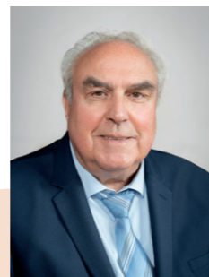
DALLE Claude À Crépy-en-Valois, notre parti c'est toujours vous