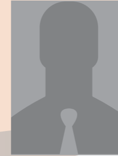
HOULLIER Michel Crépy pour tous