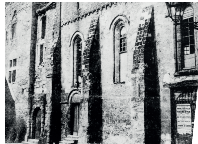
Jusque dans les années 1930, où le Musée était un théâtre. À droite, on aperçoit la porte d'entrée.

de presse et annonces hebdomadaires de la « Belle époque » nous renseignent sur la programmation crépinoise. La scène de la Grande salle est ouverte aux troupes locales ou parisiennes, mais aussi aux prestidigitateurs et spécialistes de phénomènes occultes (magnétiseurs, hypnotiseurs,...). À cette époque, notre musée accueillait également le premier cinéma de la Ville. Avec la naissance de l'image animée sur grand écran en 1896, quelques courts métrages réalisés par les opérateurs Lumière, Pathé ou Gaumont sont diffusés par des projectionnistes ambulants. Le cinéplexe « Les Toiles » du boulevard Victor Hugo a donc pour aïeul notre Musée de l'archerie !