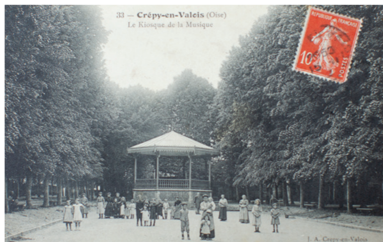
33 — Crépy-en-Valois (Oise) Le Kiosque de la Musique

À proximité de la promenade du Chemin Vert, il sera cet été encore le point d'ancrage de Crépy-Plage. Venez l'apprécier lors d'une pause lecture !