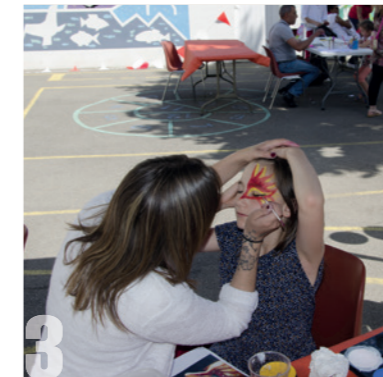
3 L'ALJ EN FÊTE Samedi 16 juin