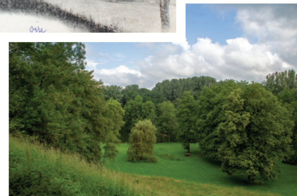
Le parc de Géresme aujourd'hui