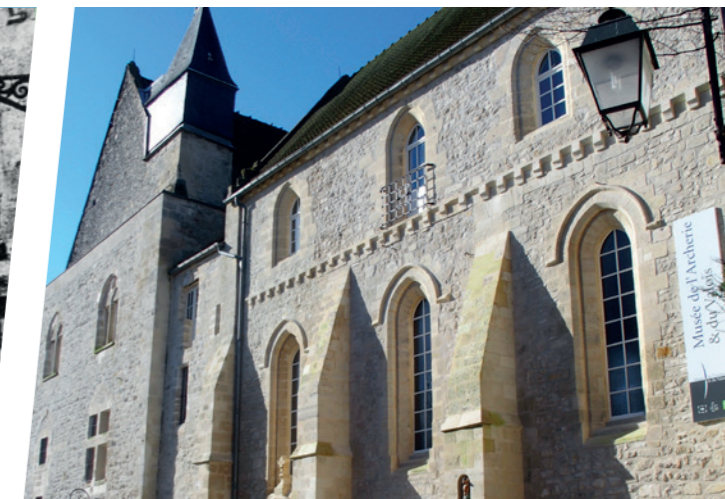
Aujourd'hui, cette porte n'existe plus. Cette façade fraîchement rénovée abrite la chapelle Saint-Aubin, entrée et boutique du musée.