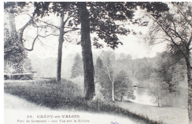
Le parc de Géresme au début des années 1900.

Dans le cadre des Journées européennes du patrimoine, le parc de Géresme fêtera ses 40 ans d'ouverture au public, les samedi 15 et dimanche 16 septembre prochains.