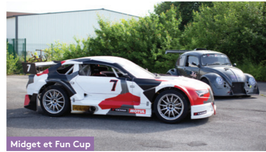
Midget et Fun Cup