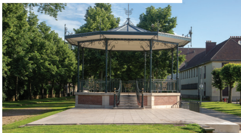
Le kiosque à musique bâti sur le cours Foch.