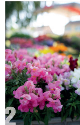
2 FLORALYS DU VALOIS Samedi 19 et dimanche 20 mai