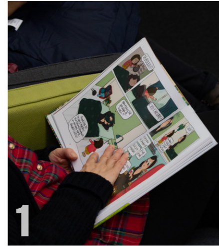
1 NUIT DE LA LECTURE Samedi 19 janvier