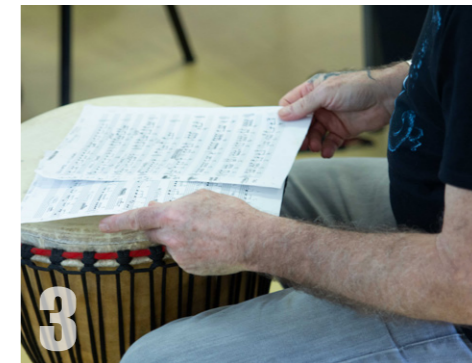
3 PERCUSSIONS AFRICAINES DU MARDI 12 AU JEUDI 14 FÉVRIER