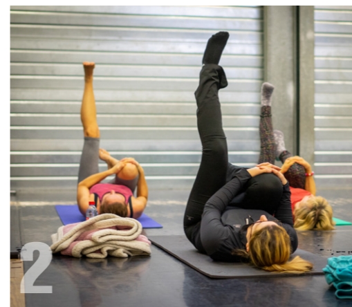
2 STAGE DE YOGA Dimanche 10 février