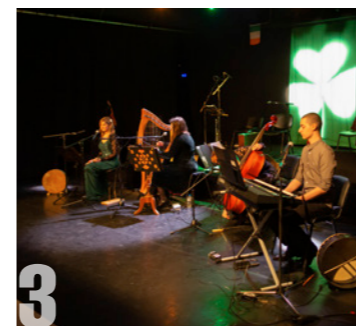
SAINT-PATRICK Vendredi 15 mars