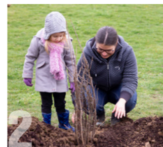
MON QUARTIER A LA MAIN VERTE Samedi 9 mars