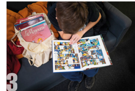
3 NUIT DE LA LECTURE Samedi 18 janvier 2020