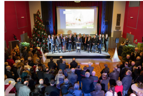
CÉRÉMONIE DES VŒUX Mercredi 15 janvier 2020