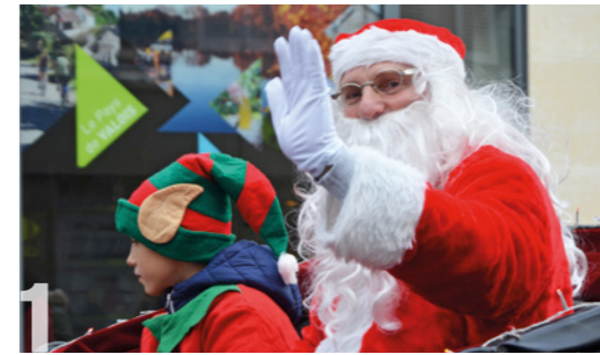
PARADE DE NOËL Samedi 22 décembre 2019