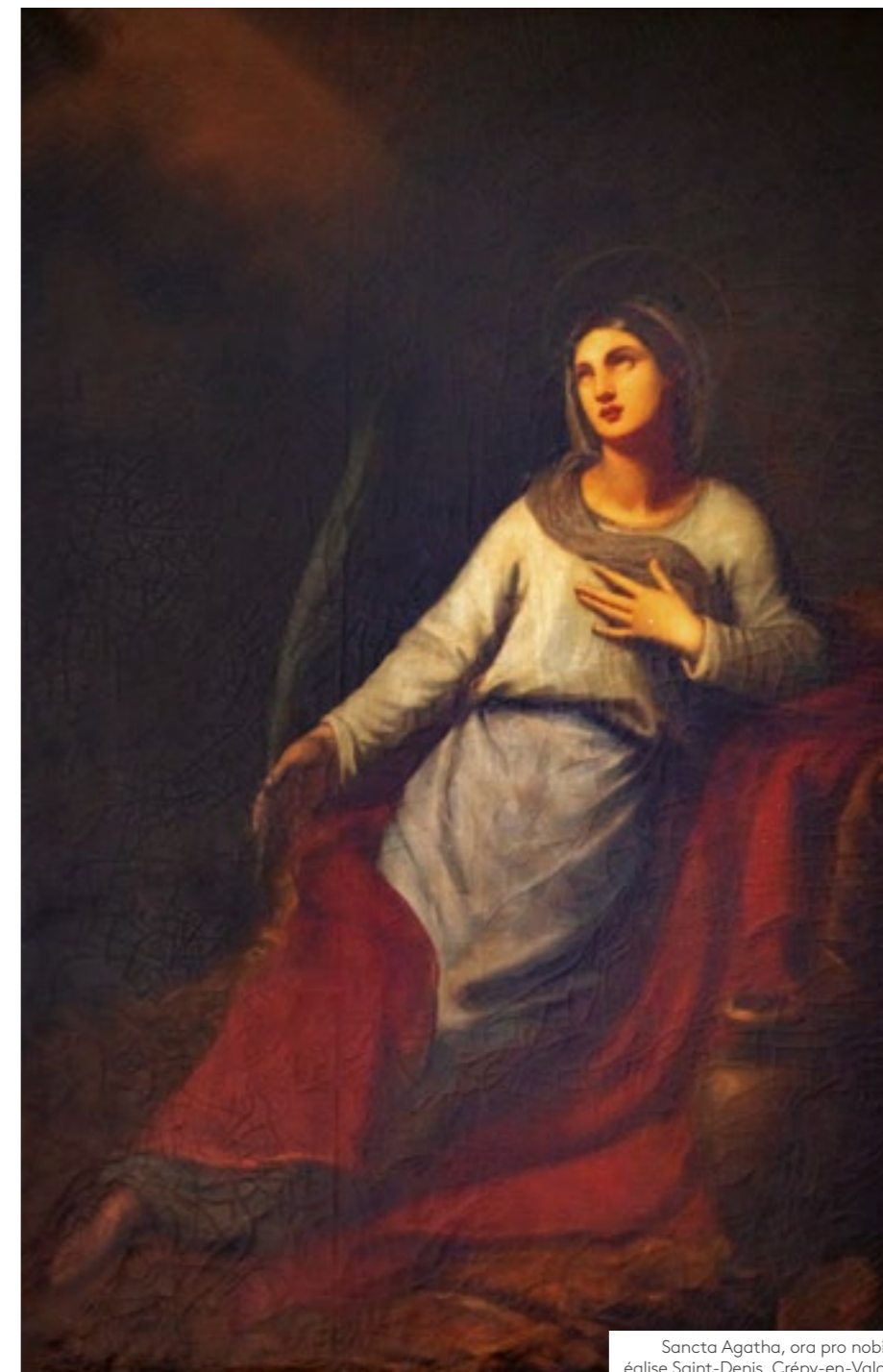
Sancta Agatha, ora pro nobis, église Saint-Denis, Crépy-en-Valois