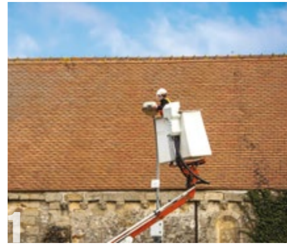
1 ÉCLAIRAGES BASSE CONSOMMATION MARS 2021