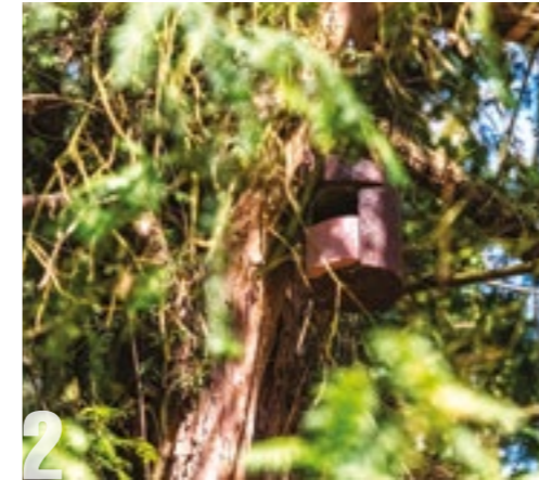
2 DES NICHOURS POUR LES OISEAUX LUNDI 22 MARS