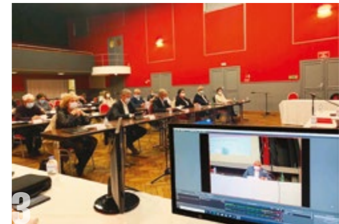
3 CONSEILS MUNICIPAUX EN DIRECT VENDREDI 26 ET MARDI 30 MARS