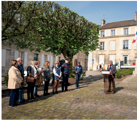
30 avril : commémoration du souvenir des victimes et des héros de la déportation.