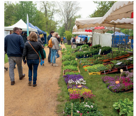
Weekend rythmé avec plus de 50 exposants en jardinage, artisanat et produits du terroir ainsi que des animations pour les plus jeunes.