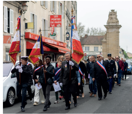
8 mai : 78 e anniversaire de la fin de la Seconde Guerre mondiale.