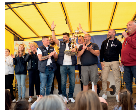
Associations, entreprises et commerçants locaux se sont affrontés sur la piste. Bravo au XV Crépynois, grand vainqueur de la course !