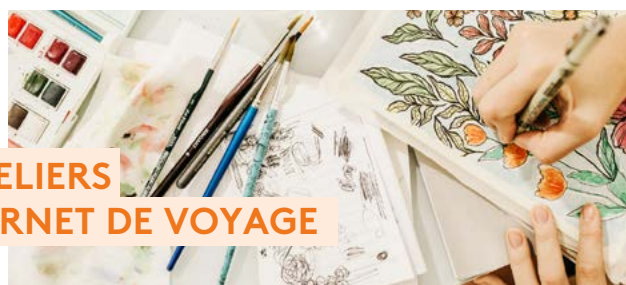
ATELIERS CARNET DE VOYAGE

Proposées par Laura Garnier et son atelier patrimonial - Little Preservationist - en partenariat avec la Ville, les Renc'Arts d'été sont l'occasion de vivre une expérience culturelle unique mêlant art et patrimoine à l'abbaye Saint-Arnoul !