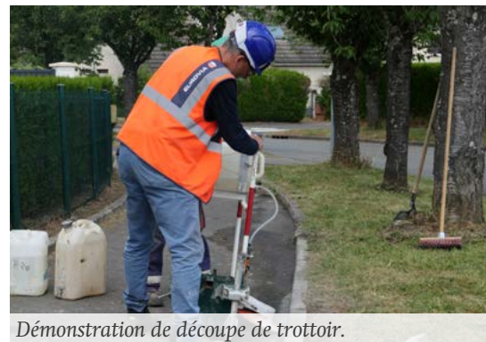
Démonstration de découpe de trottoir.

Le jury national des Villes et Villages Fleuris s'est rendu à Crépy-en-Valois qui concourt à l'obtention de la 4 e fleur. Résultat à l'automne prochain !