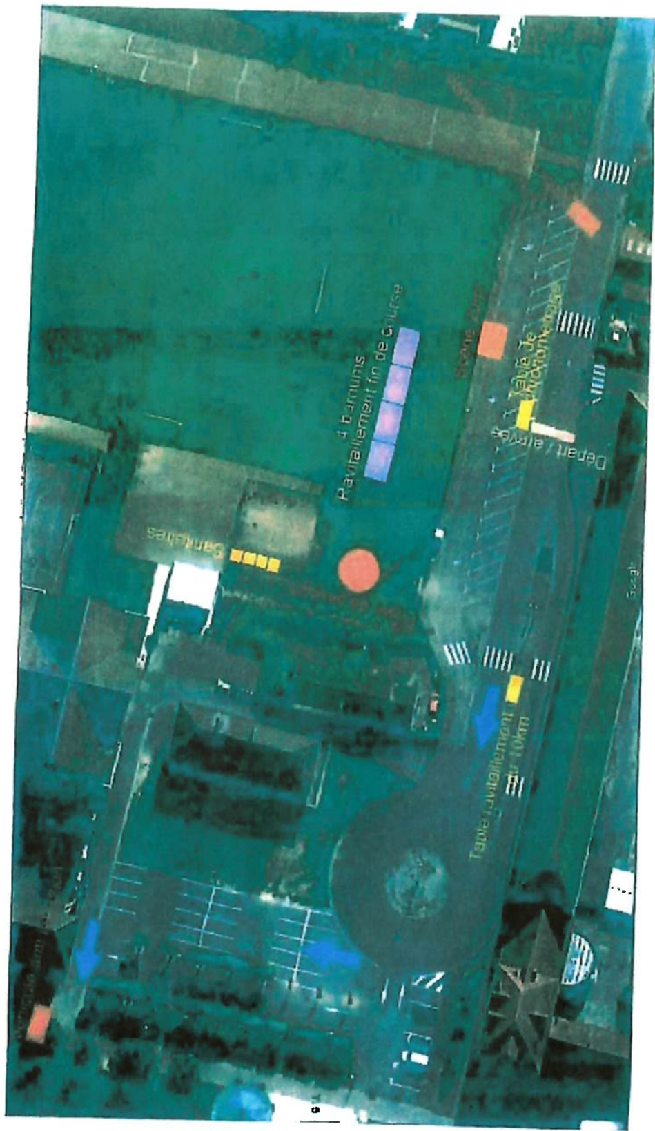
CREPYNOISE 2023 - Stade G. de Nerval