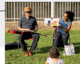
4 Bébés lecteurs