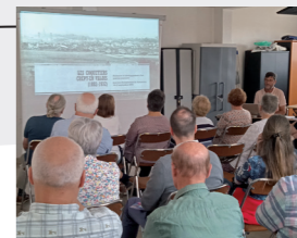
5 Crépy-en-Valois à la Libération : des lendemains qui déchantent ?