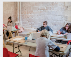
2 Ateliers mosaïque