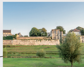
1 Histoire des remparts de Crépy pendant les guerres de religion