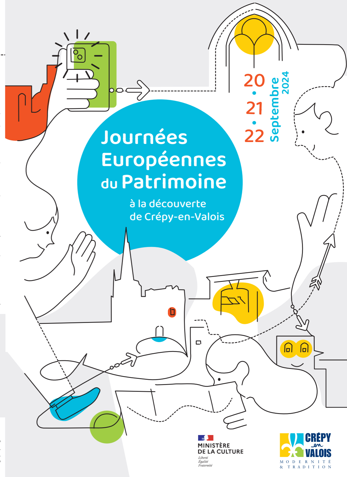
Création graphique: grisouris.fr