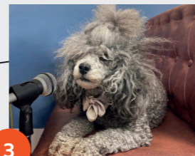
3 Dialogues de bêtes, causerie musicale