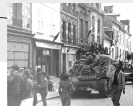
6 Crépy-en-Valois en 1944 : la liberté retrouvée ?